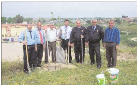
Sarayköy Açık Ceza İnfaz Kurumu çevresindeki araziye çok sayıda ağaç dikildi.