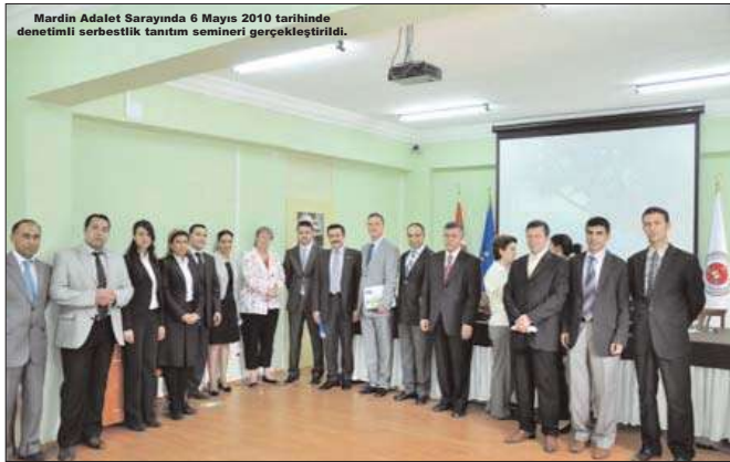
Mardin Adalet Sarayında 6 Mayıs 2010 tarihinde denetimli serbestlik tanıtım semineri gerçekleştirildi.

Toplantı katılımcıların sorularının cevaplanması ile sona erdi.