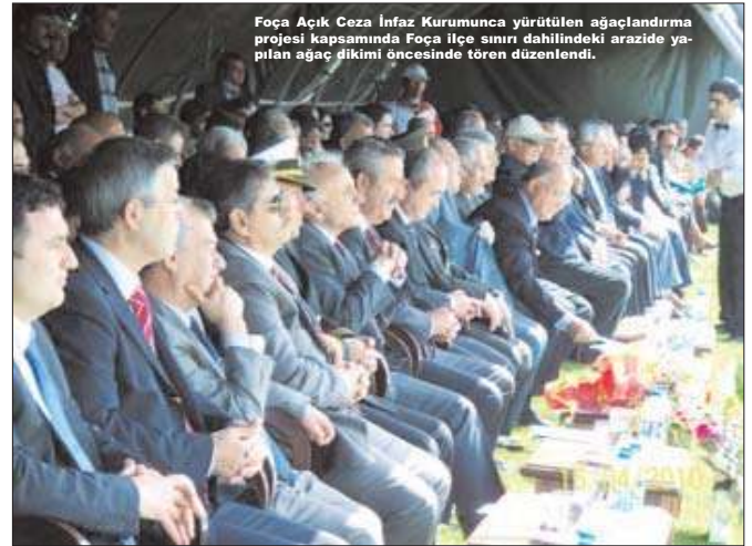
Foça Açık Ceza İnfaz Kurumunda yürütülen ağaçlandırma projesi kapsamında Foça ilçe sınırları dahilindeki arazide yapılan ağaç dikimi öncesinde tören düzenlendi.

'Her öğrenciye bir fidan, her fidan bir yaşam' kampanyası ile hayat bulan proje ile Foça Açık Ceza İnfaz Kurumu sınırları içerisindeki 1.400 dekarlık meylli ve makilik alan tamamen ağaçlandırıldı.