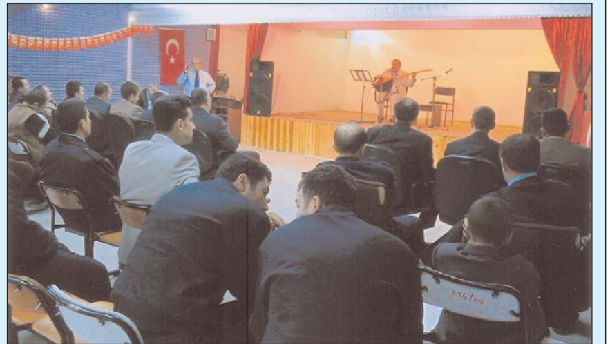
Bayburt M Tipi Kapalı Ceza İnfaz Kurumunda Ramazan Ayı nedeniyle gerçekleştirilen moral gecesinde Protokol üyeleri, Kurum personeli ile hükümlü ve tutuklular keyifli anlar yaşadılar.