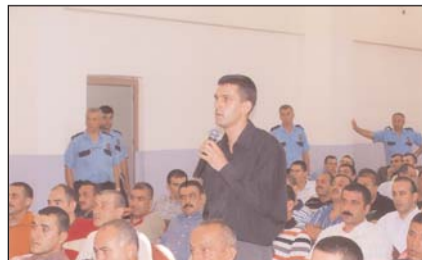
Toplantıda; hükümlü ve tutuklular sorunlarını çözüm masasına iletiler.

14 EYLÜL'de Kurumun konferans salonunda gerçekleştirilen toplantıya her odayı temsilen üç kişi olmak üzere toplam 162 hükümlü ve tutuklu katıldı. Devamı 7'de