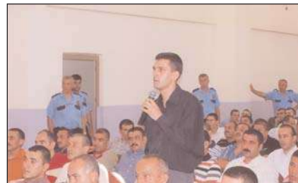
Toplantıda; hükümlü ve tutuklular sorunlarını çözüm masasına iletiler.

14 EYLÜL'de Kurumun konferans salonunda gerçekleştirilen toplantıya her odayı temsilen üç kişi olmak üzere toplam 162 hükümlü ve tutuklu katıldı. Devamı 7'de