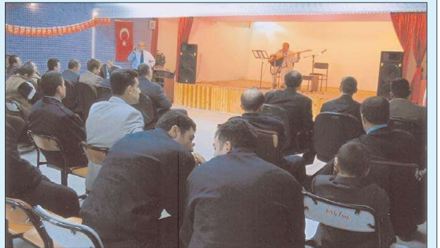
Bayburt M Tipi Kapalı Ceza İnfaz Kurumunda Ramazan Ayı nedeniyle gerçekleştirilen moral gecesinde Protokol üyeleri, Kurum personeli ile hükümlü ve tutuklular keyifli anlar yaşadılar.