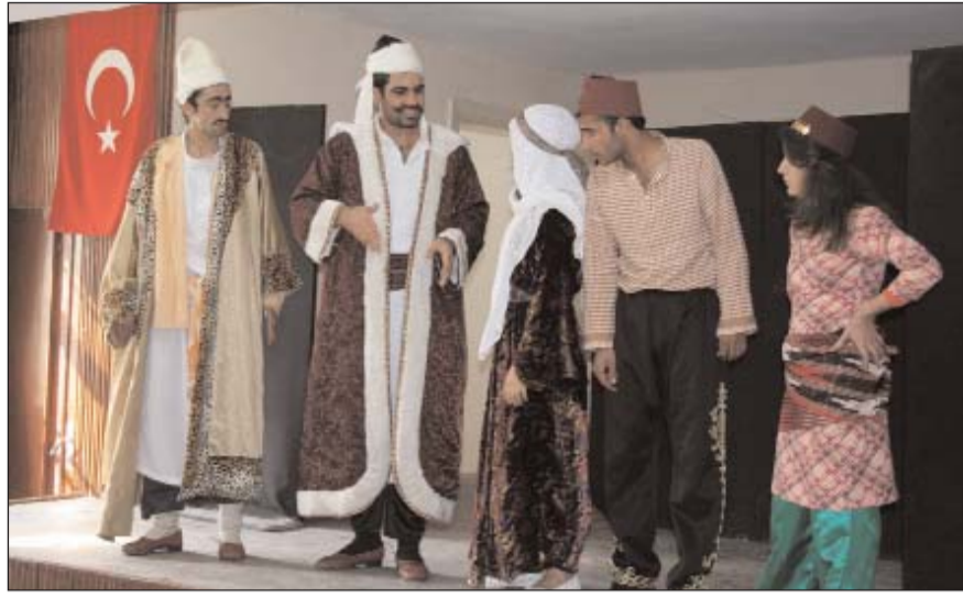
Şanlıurfa Belediyesi Şehir Tiyatrosu oyuncularını sahneledikleri orta oyunuyla hükümlü ve tutuklulara neşe dolu dakikalar yaşattılar.

Program çerçevesinde, biçki-dikiş kursundan 15 kadın ve arıcılık kursundan 23 erkek hükümlü ve tutukluya Protokol üyeleri tarafından sertifikaları verildi.