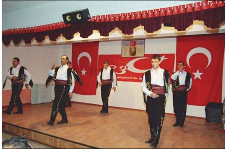
Bandırma M Tipi Kapalı Ceza İnfaz Kurumunda yapılan Cumhuriyet Bayramını kutlama programında; hükümlülerden oluşan ekip halk oyunları gösterisi sundu.

29 EKİM Cumhuriyet Bayramı tüm yurttaki gibi ceza infaz kurumlarında da büyük bir coşkuyla kutlandı.