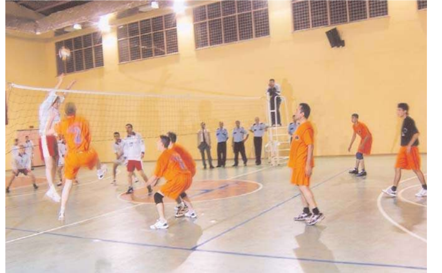
Osmangazi Belediyespor Voleybol Takımıyla yapılan dostluk maçını 3-2 kaybeden Ceza İnfaz Kurumu Voleybol Takımı ortaya koyduğu mücadeleyle takdir topladı.

Etkinliğe, ulusal ve yerel basın da büyük ilgi gösterdi.