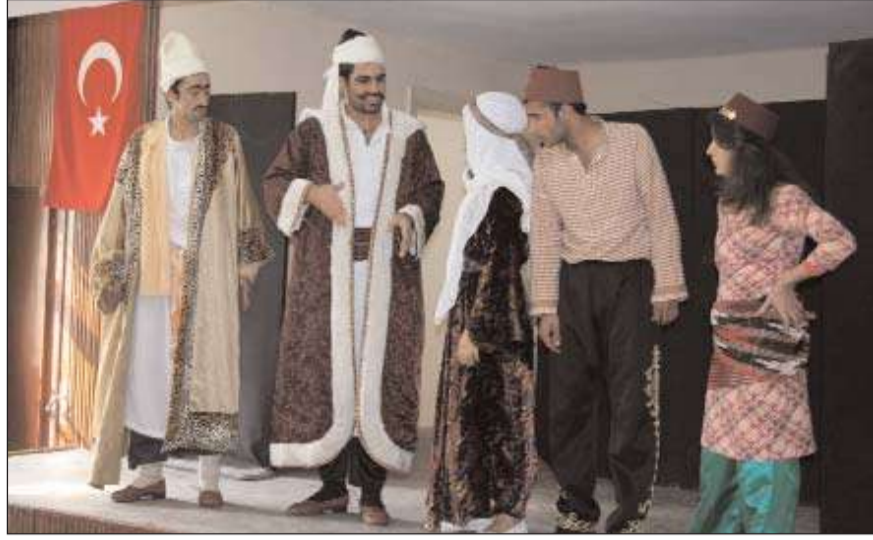
Şanlıurfa Belediyesi Şehir Tiyatrosu oyuncularını sahneledikleri orta oyunu ile hükümlü ve tutuklulara neşe dolu dakikalar yaşattılar.

Program çerçevesinde, biçki-dikiş kursundan 15 kadın ve arıcılık kursundan 23 erkek hükümlü ve tutukluya Protokol üyeleri tarafından sertifikaları verildi.