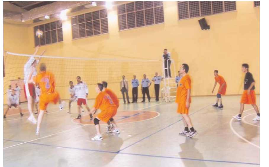
Osmangazi Belediyespor Voleybol Takımıyla yapılan dostluk maçını 3-2 kaybeden Ceza İnfaz Kurumu Voleybol Takımı ortaya koyduğu mücadeleyle takdir topladı.

Etkinliğe, ulusal ve yerel basın da büyük ilgi gösterdi.