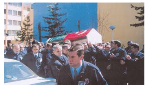
Erzurum ÇIKPEM'de düzenlenen törende; mesal arkadaşları büyük üzüntü yaşarken, merhumu son yolcuğu için Ünye'ye götürecek araca kadar omuzlarda taşıdılar.