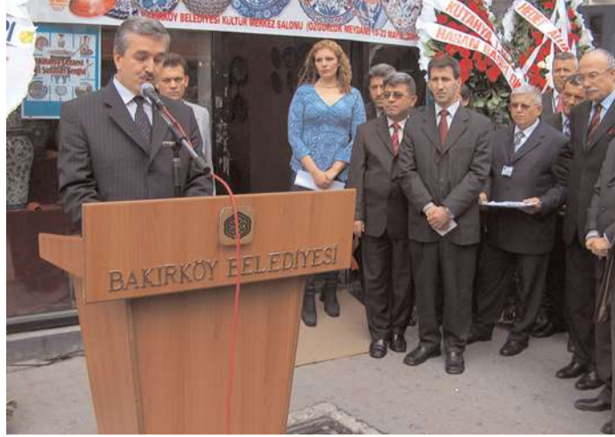
Ceza ve Tevkifleri Genel Müdür Yardımcısı Nizamettin Kalaman, serginin açılışında yaptığı konuşmada, böylesine muhteşem ürünlere imza atan hükümlü ve tutuklular ile kurum yetkililerine teşekkür etti.

Açılış kurdelesini Ceza ve Tevkifleri Genel Müdür Yardımcısı Nizamettin Kalaman tarafından kesilen sergi, 23 Mayıs'a kadar açık kaldı. Yaklaşık 50.000 ziyaretçi tarafından yoğun ilgi ve beğeniyle karşılanan el sanatları sergisinde, hükümlü ve tutuklularca üretilen çeşitli türde 9231 eserin satışı yapılırken, 62.740,50 YTL de gelir elde edildi.