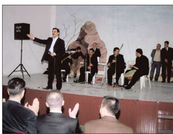
LATİF DOĞAN'DAN KONSER ÇOŞKUSU Ünlü Sanatçı Latif Doğan, Mersin E Tipi Kapalı Ceza İnfaz Kurumunda ikinci kez konser verdi. Sanatçı Doğan 28 Şubatta verdiği konsere birbirinden güzel parçalarını seslendirdi. Hükümlü ve tutukluların doyusya eğlendiği konsere büyük coşku yaşandı.

Programa; Altındağ Halk Eğitimi Merkezi ve 9. Akşam Sanat Okulu Müdürlüğü Halk Oyunları Ekibi de sundukları gösteri ile katkıda bulundu. Hareketli anların yaşandığı gösteri sırasında hükümlüler de oyunlara eşlik ettiler.