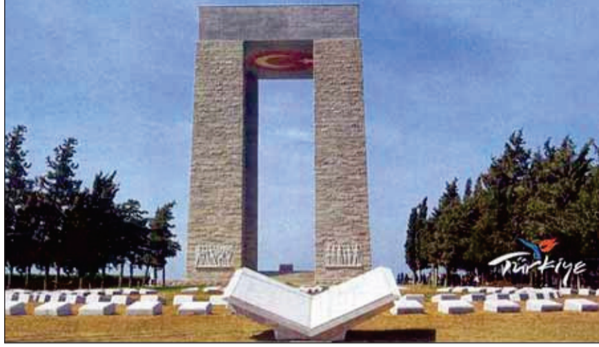
Çanakkale Şehitler Abidesi-Gelibolu