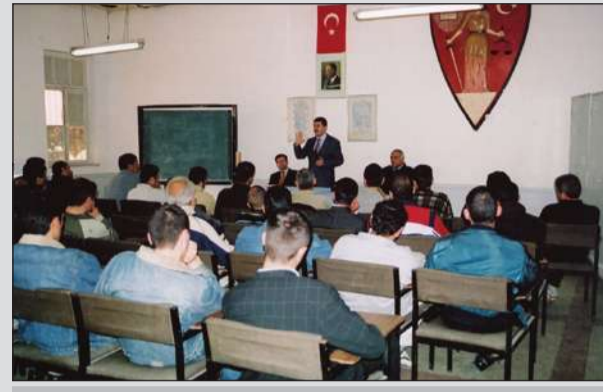
Ankara Kapalı Cezaevinden konferans

Uzmanların, cezaevinde görev yapan personele intiharın önlenmesi konusunda önemli bilgileri aktardığı konferans, konuyla ilgili soruların cevaplandırılmasıyla sona erdi.