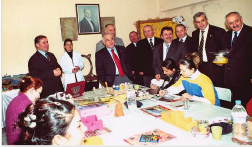
Adalet Bakanı Cemil Çiçek, cezaevini ziyaretinde tutuklu ve hükümlü bayanların el işi çalışmalarını inceledi.

Muş Valisi İbrahim Özçimen, Muş E Tipi Kapalı Cezaevini ziyaret ederek televizyon hediye etti. Cumhuriyet Başsavcısı Necmettin Saygın ile birlikte cezaevini ziyaret eden Vali Özçimen'e cezaevi yetkilileri tarafından brifing verildi. Brifingin ardından cezaevini gezen Vali Özçimen, uygulamaları yerinde gördü. Çalışmaları takdirle karşılayan Vali Özçimen, cezaevine bilgisayar odası kurulması için destek sözü verdi.