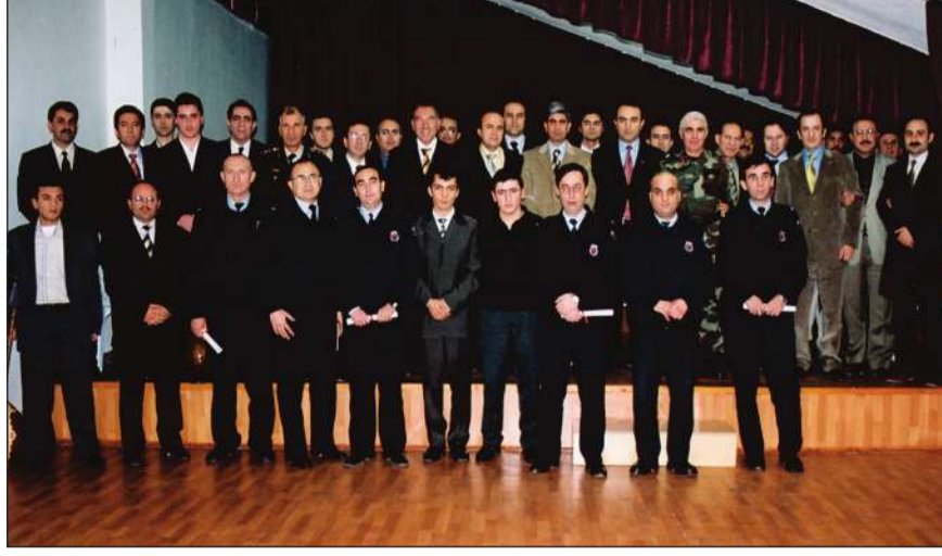
Büyük coşku yaşanan konserin sonunda tutuklu ve hükümlülere kurs sertifikaları takdim edilirken infaz ve koruma başmemurluğuna terfi eden personele de yeni görev beratları verildi.