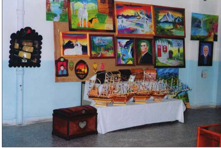
Tutuklu ve hükümlüler tarafından yapılan ürünleri dikkatle inceleyen ziyaretçiler, cezaevinde böylesine ürünlere imza atılmasının sevindirici olduğunu vurguladılar.

Tören nedeniyle bir konuşma yapan Cumhuriyet Savcısı Tuncer Çetin, açılan kurslar ile tutuklu ve hükümlülerin meslek edinmelerinin, sergide yer alan ürünler gibi güzel çalışmalar yaparak zaman geçirmelerinin ve elde edecekleri gelir ile bir nebze de olsa ailerine de katkı sağlamalarının amaçlandığını söyledi.