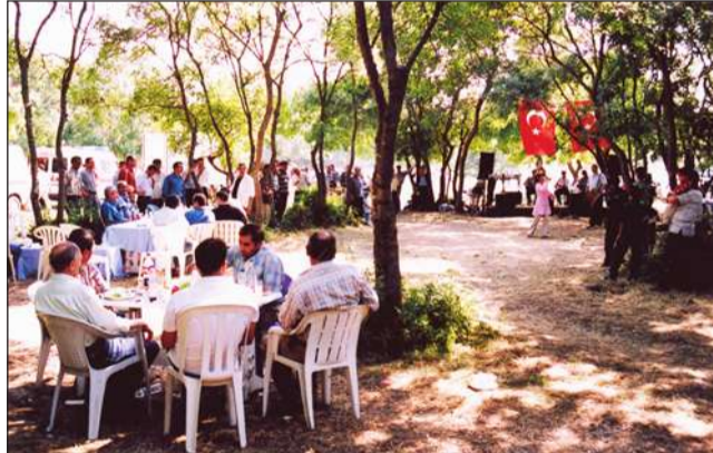
Sebahat Aslan’ın verdiği konser ile eğlenen İstanbul Kapalı Cezaevi personeli Durusu Beldesi piknik alanında buluştular.

Personelin moral ve motivasyonunun artırılması için düzenlenen pikniğe ilgi büyüktü.