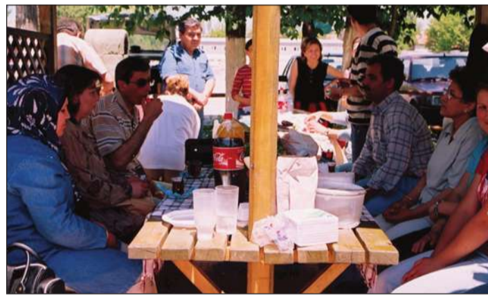
Ankara Kapalı Cezaevi personeli, Ankara Açık Cezaevi Şaşmaz Piknik Alanında bir araya geldi.