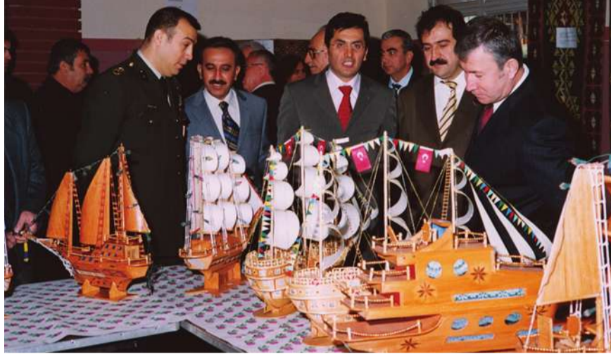
Maharetlerini sergileyen tutuklu ve hükümlülerin ürünlerine ilgi büyüktü.

Serginin açılışından sonra törende bir konuşma yapan Cumhuriyet Başsavcısı Süleyman Bal, geçmişten günümüze ceza yöntemleri ile ilgili bilgiler verirken, "Çağımızda cezaevleri öğ alma veya cezalandırma kurumları olmaktan ziyade; toplumun suçludan korunması, suçlunun toplumun öfkesinden korun-