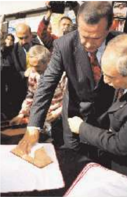
Sergiyi ziyaret eden Başbakan Recep Tayyip Erdoğan, ürünleri inceleyerek yetkililerden bilgi aldı.

Cumhuriyetin 80. yıldönümü nedeniyle Tokat Kapalı Cezaevi İşyurdu'nda üretilen ürünler Ankara'da düzenlenen İller Sergisinde ziyaretçilerin beğenisine sunuldu.