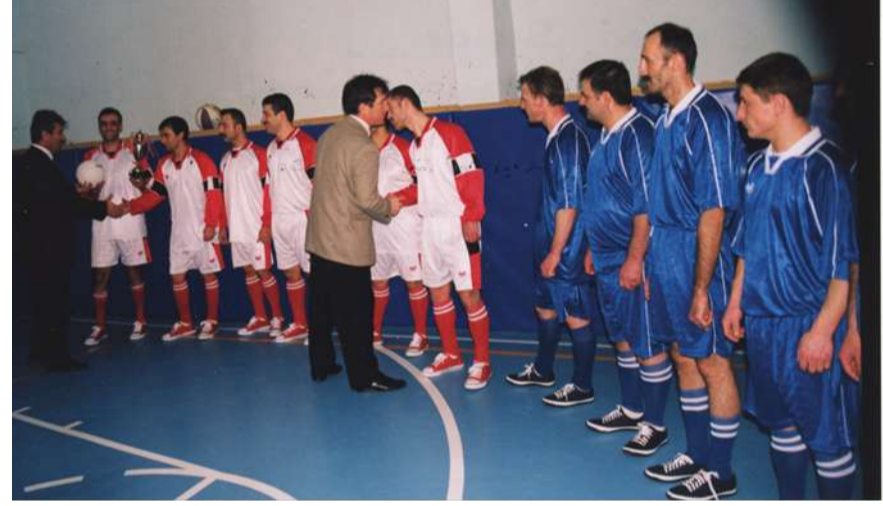
Dereceye giren takımın oyuncularını tek tek tebrik edildi.