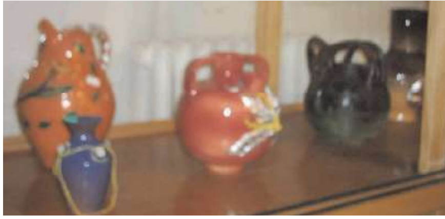
Ziyaretçiler tarafından çok beğenilen bu vazolar, aynı zamanda çocukların hayallerini yansıtıyor.