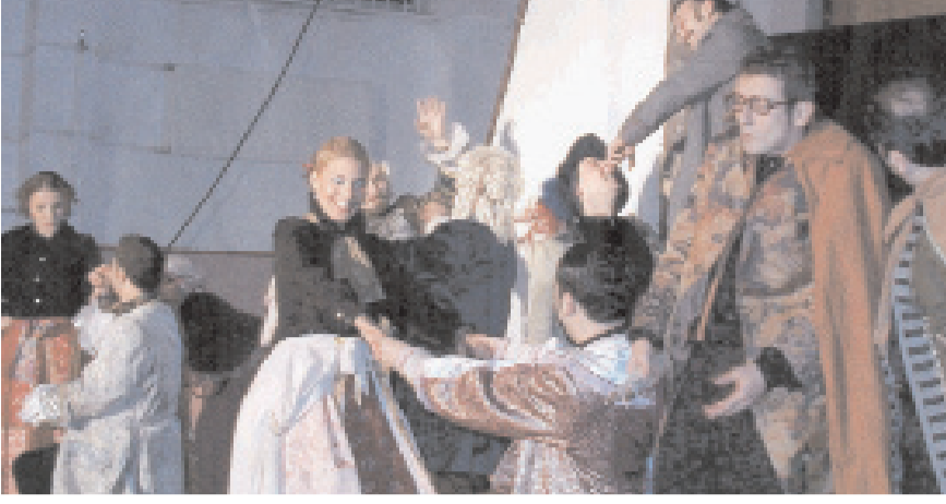
Devlet Tiyatrolarınca sahnelenen oyun cezavinde büyük ilgi gördü.