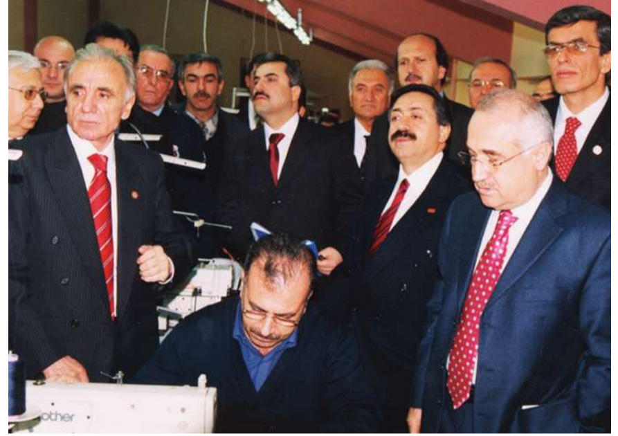
Beraberindeki heyet ile, yeni kurulan konfeksiyon atölyesini inceleyen Bakan Çiçek, tutuklu ve hükümlülerle zaman zaman sohbet etti.

Bakan Çiçek, konfeksiyon atölyesinin çok büyük bir proje olduğunu ifade ederken, şunları kaydetti: