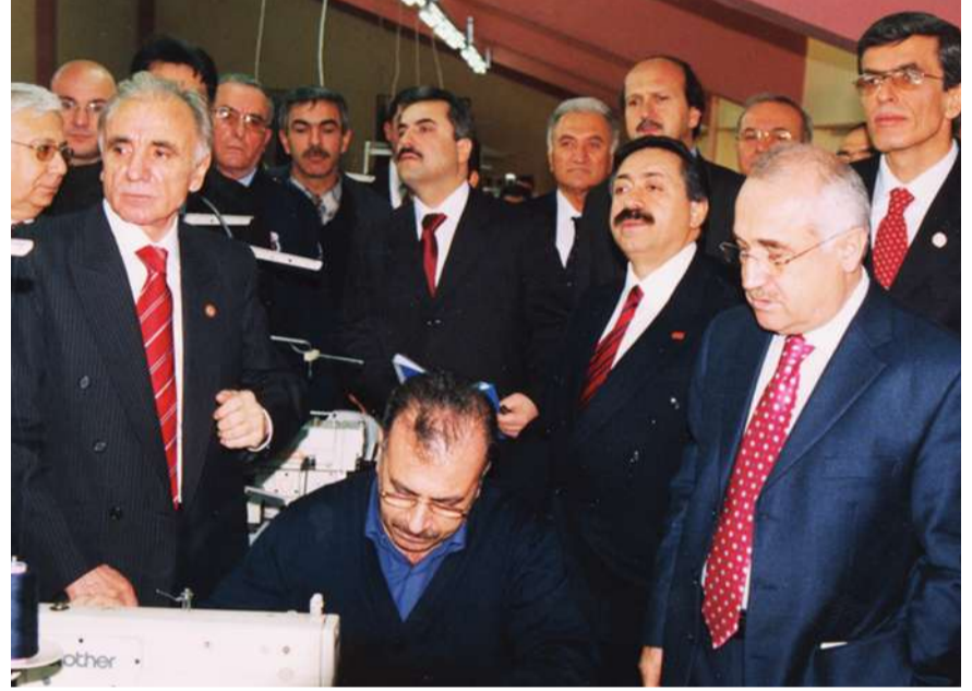
Beraberindeki heyet ile, yeni kurulan konfeksiyon atölyesini inceleyen Bakan Çiçek, tutuklu ve hükümlülerle zaman zaman sohbet etti.

Bakan Çiçek, konfeksiyon atölyesinin çok büyük bir proje olduğunu ifade ederken, şunları kaydetti: