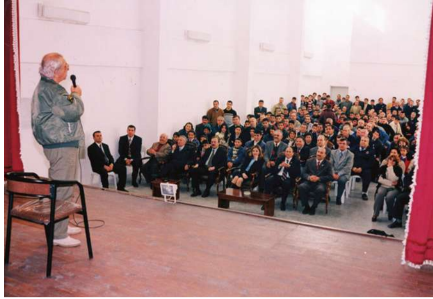
Hatay Cezaevinde tek kişilik bir oyun sahneleyen ünlü Tiyatrocu Nejat Uygur, gösterilen ilgiden dolayı herkese teşekkür etti.

Turne amacıyla Hatay'a gelen ünlü Tiyatrocu Nejat Uygur, E Tipi Kapalı Cezaevinde bir tiyatro oyunu sahneledi ve izleyicilerden büyük beğeni topladı.