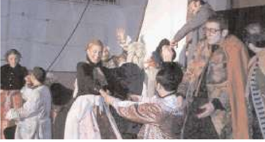
Devlet Tiyatrolarınca sahnelenen oyun cezavinde büyük ilgi gördü.