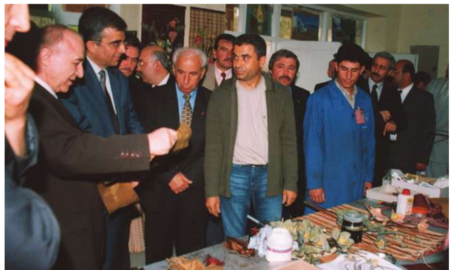
Aksaray Kapalı Cezaevinde açılan sergiden görünüş.

den sonra hükümlü oldukları gerekçesiyle kendilerine iş verilmeyen hükümlülere, sermaye gerektirmeyen, evlerinde bile olsa çalışarak