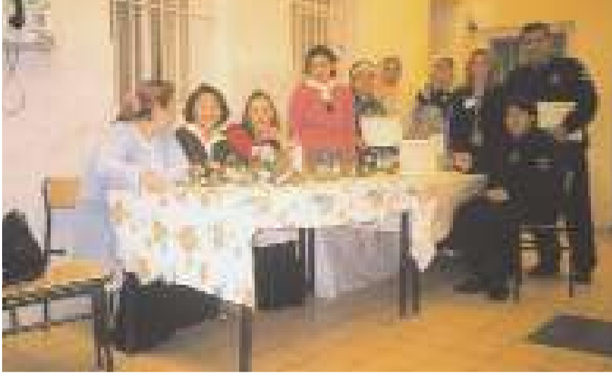
Osmaniye Kapalı Cezaevinde düzenlenen okuma-yazma ve kuaförlük kursunda belge alan bayan hükümlü ve tutuklular toplu halde.