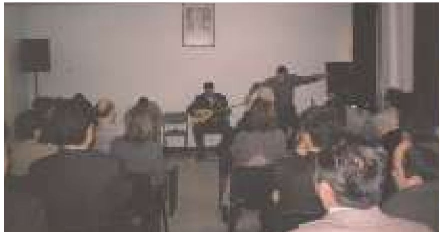
Elmadağ Çocuk Tutukevinde yapılan 23 Nisan Ulusal Egemenlik ve Çocuk Bayramında müzik etkinlikleri.

Bayramı töreni yapılmıştır. Tören tutuklu bir çocuk tarafından günün anlam ve önemini belirten bir konuşma ile başlamıştır. Yine çocukların sunduğu Atatürk Oratoryası, 23 Nisan şiirleri ve Atatürkten özdeyişler, mizah ve skeçlerle devam eden kutlama programı, bağlama kursuna devam eden öğrenci çocuklardan oluşan bağlama ekibi tarafından seslendirilen