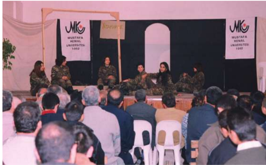
Hatay E Tipi Kapalı Cezaevi'nde Mustafa Kemal Üniversitesi öğrencilerinin sunduğu "Kadınlık Bizde Kalsın" adlı tiyatro gösterisi büyük ilgi gördü.

Hatay E Tipi Kapalı Cezaevinde, Mustafa Kemal Üniversitesi öğrencileri tarafından sahnelenen "Kadınlık Bizde Kalsın" adlı tiyatro gösterisi hükümlü ve tutuklular tarafından ilgiyle izlenmiştir.