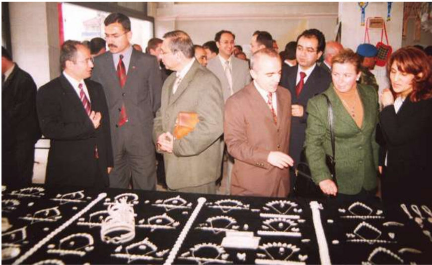
Midyat Özel Tip Cezaevinde 23 Nisan Ulusal Egemenlik ve Çocuk Bayramı etkinliği ve el sanatları sergisi yoğun ilgi gördü.

Midyat Özel Tip Cezaevinde, 23 Nisan Ulusal Egemenlik ve Çocuk Bayramı Şenlikleri kapsamında hükümlü ve tutukluların yaptıkları el sanatları ürünleri sergisi 22 Nisan 2003 tarihinde halkın yoğun ilgisiyle açılmıştır.