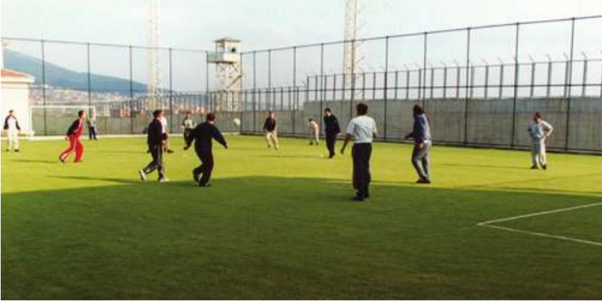
Kartal Özel Tip Kapalı Cezaevinde, koğuşlararası halı saha müsabakası.