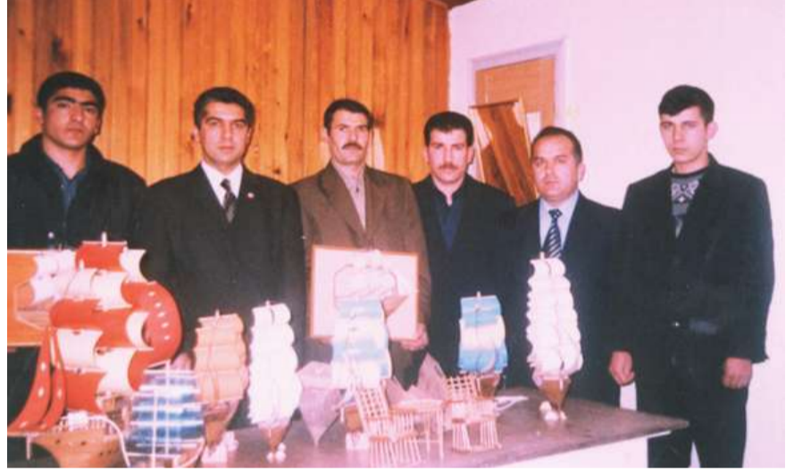
Oltu Kapalı Cezaevinde düzenlenen kurslarda hak sahiplerine belgeleri törenle verildi.

Hâlen 1 inci kademe okuma-yazma, bağlama ve bayan hükümlü ve tutuklulara yönelik olarak açılan makrome, dokumacılık ve örücülük kursları devam etmektedir.