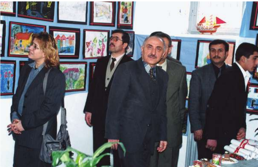
Konya E Tipi Kapalı Cezaevi'nde resim sergisini davetliler geziyor.

Ayrıca turizm, makine nakış, İngilizce, bağlama, modern hayvancılık, arıcılık ve renkli resim kurslarına katılarak başarılı olan hükümlü ve tutuklulara belgeleri düzenlenen törenle verilmiştir.