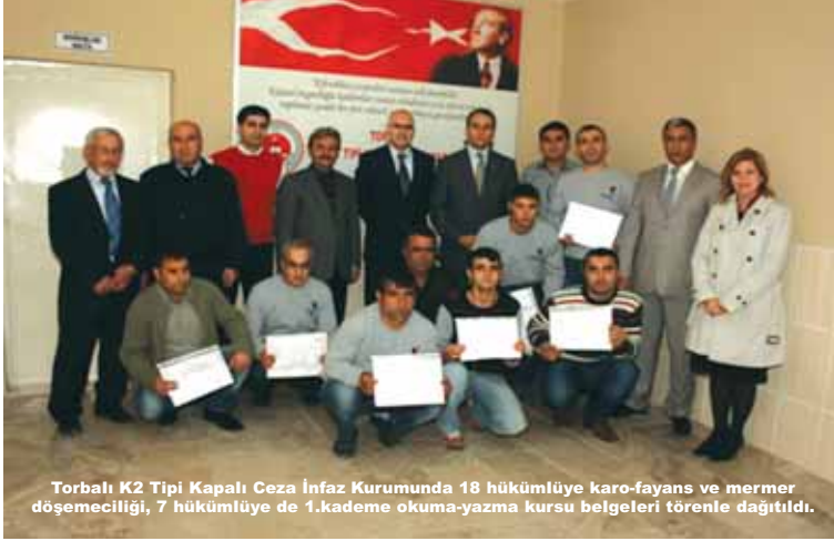
Torbali K2 Tipi Kapalı Ceza İnfaz Kurumunda 18 hükümlüye karo-fayans ve mermer döşemeciliği, 7 hükümlüye de 1.kademe okuma-yazma kursu belgeleri törenle dağıtıldı.

Torbali K2 Tipi Kapalı Ceza İnfaz Kurumunda, İzmir İşkur İl Müdürlüğü iş birliğiyle düzenlenen karo-fayans ve mermer döşemeciliği kursu ile Halk Eğitim Merkezi işbirliğiyle düzenlenen 1. kademe okuma yazma kursu belgeleri 16.02.2011 tarihinde yapılan törende dağıtıldı.