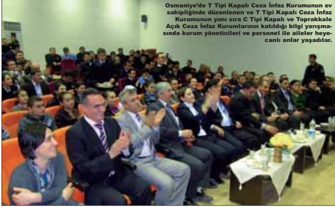
Osmaniye'de T Tipi Kapalı Ceza İnfaz Kurumunun ev sahipliğinde düzenlenen ve T Tipi Kapalı Ceza İnfaz Kurumunun yanı sıra C Tipi Kapalı ve Toprakkale Açık Ceza İnfaz Kurumlarının katıldığı bilgi yarışmasında kurum yöneticileri ve personel ile aileler heyecanlı anlar yaşadılar.

Osmaniye'de C Tipi ve T Tipi Kapalı Ceza İnfaz Kurumları ile Toprakkale Açık Ceza İnfaz Kurumu personeli arasında bilgi yarışması yapıldı. İlk kez gerçekleştirilen yarışmaya personel büyük ilgi gösterdi.