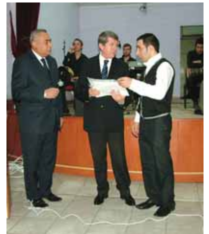
Cumhuriyet Başsavcısı Ekrem Aydın, hükümlü ve tutuklulara diploma ve belgelerini verdi.

Sertifika dağıtımından sonra, televizyon sanatçısı Kazım Günbaşar (Sosyete Kazım) ve mahallî sanatçılar tarafından verilen konserde hükümlü ve tutuklular, coşku içerisinde gönüllü- rince eğlendiler.