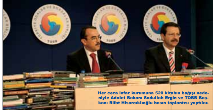
Her ceza infaz kurumuna 520 kitabın bağıışı nedeniyle Adalat Bakanı Sadullah Ergin ve TOBB Başkanı Rifat Hisarcıklıoğlu basın toplantısı yaptılar.

TÜRK ve Dünya Edebiyatının seçkin eserlerinden oluşan, hükümlü ve tutukluların eğitim ve iyileştirilmelerine destek olunması amaçlanan kitap bağıışı nedeniyle 02.03.2011 tarihinde, TOBB Konferans Salonunda tören düzenlendi. 2'de