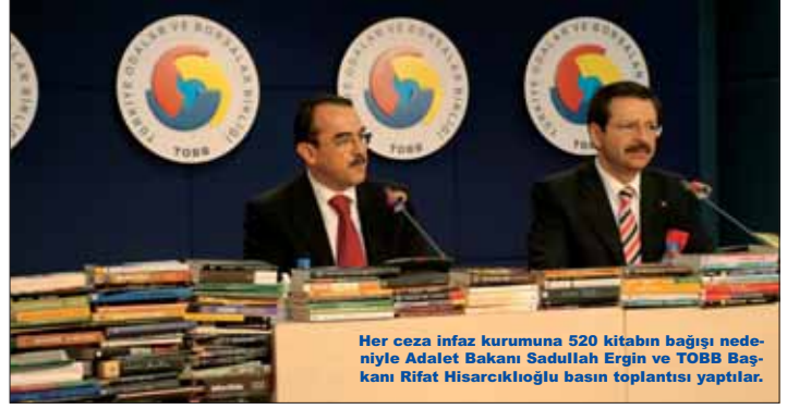
Her ceza infaz kurumuna 520 kitabın bağıışı nedeniyle Adalet Bakanı Sadullah Ergin ve TOBB Başkanı Rifat Hisarcıklıoğlu basın toplantısı yaptılar.

TÜRK ve Dünya Edebiyatının seçkin eserlerinden oluşan, hükümlü ve tutukluların eğitim ve iyileştirilmelerine destek olunması amaçlanan kitap bağıışı nedeniyle 02.03.2011 tarihinde, TOBB Konferans Salonunda tören düzenlendi. 2'de