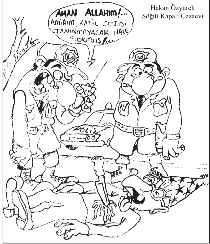
Hakan Özyürek Söğüt Kapalı Cezaevi

Ekonomik imkânlar çerçevesinde personel ile cezaevi ortamı dışında eğlence amaçlı toplantılar yapılması da plânlanmıştır.